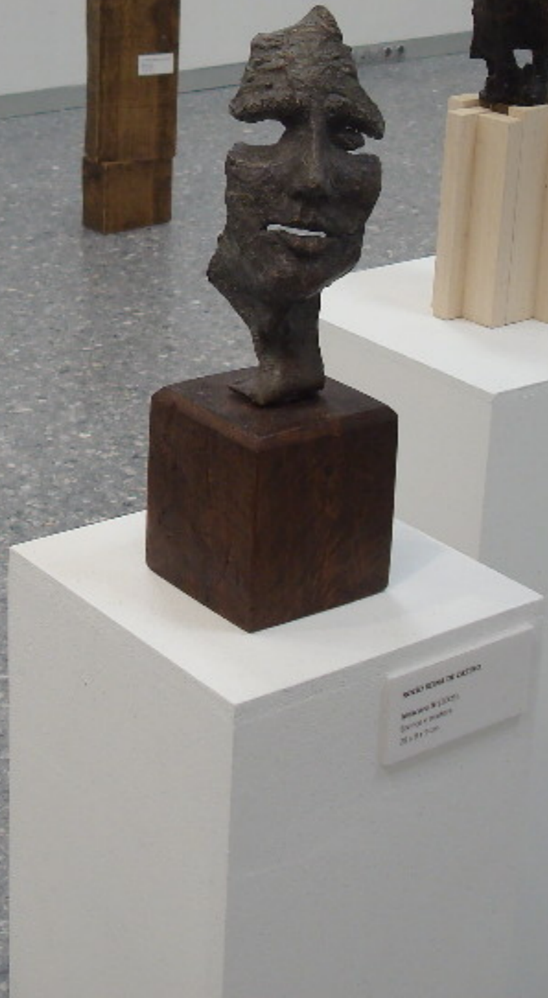
BERNARDO BOTEIRO Sculpture 2011