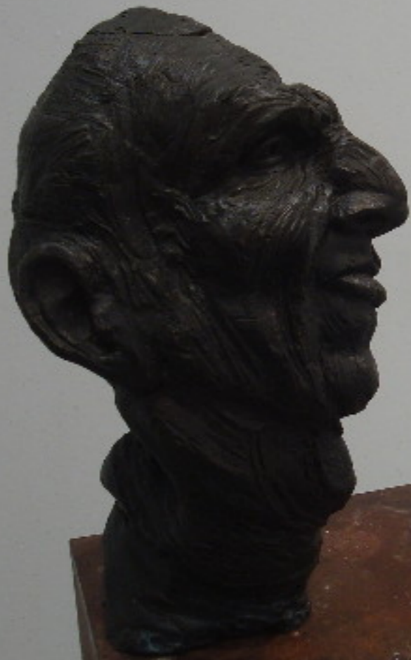
JOHANNES LINDBERG KOPPEL (1911) BRONZE 23 x 10 x 10 cm