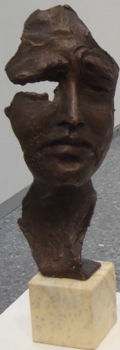
ROCÍO REINA DE CASTRO Alto - Mística II (2006) Bronce y piedra 29,5 x 10,5 x 9 cm.