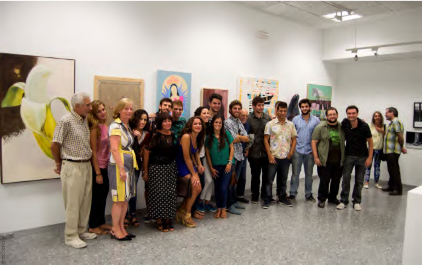
Los artistas expositores en una fotografía de grupo