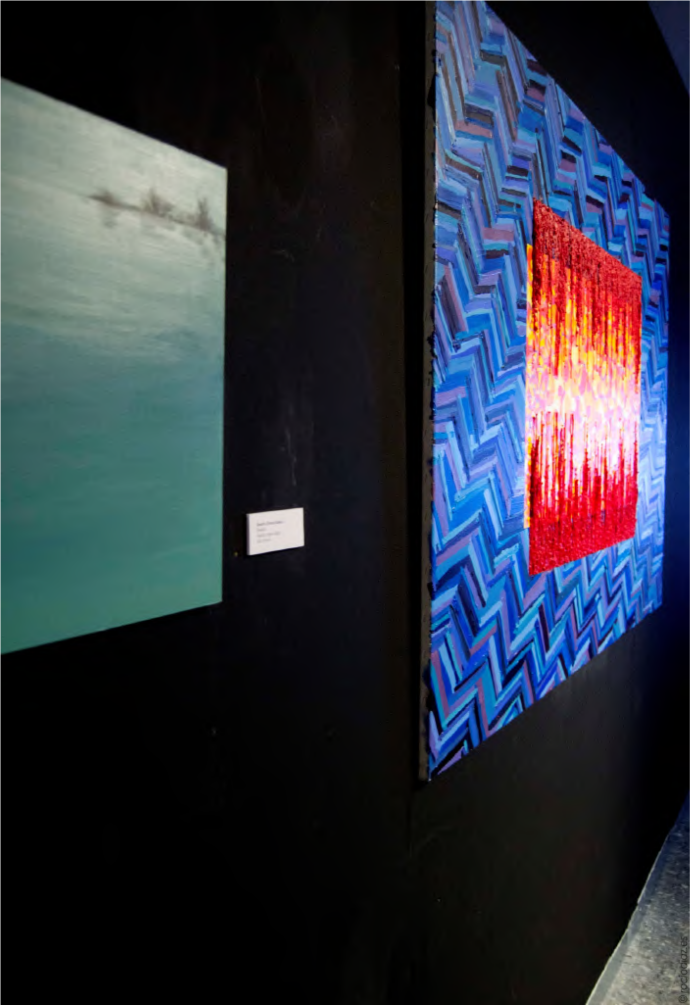
Artwork information label