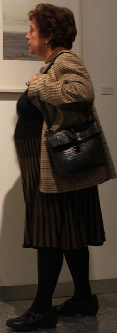
Small white label with text, likely providing information about the artwork on the left.